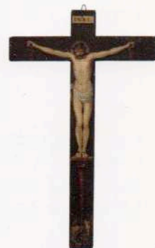
Cristo crucificado Anónimo español Siglo XVII

Los tesoros artísticos guardados en las clausuras de los conventos y monasterios madrileños son capaces de transmitir las profundas e intensas formas de religiosidad como expresión del mundo de silencio y recogimiento interior que rodea la vida de las congregaciones religiosas. Pero también constituyen piezas fundamentales de la historia del patrimonio cultural de una sociedad, de la que los propios conventos y monasterios son parte en el intrincado, y a veces misterioso, conjunto de relaciones que muchos hombres y mujeres establecieron y establecen con su Dios. Un patrimonio histórico que ha ido dejando sus huellas profundas y contundentes unas veces, apenas imperceptibles y delicadas otras, para pasar a formar parte de la memoria colectiva de toda una sociedad.