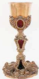
Cáliz Nápoles Anterior a 1708