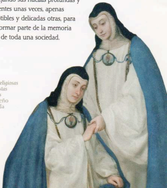
Retrato de religiosas concepcionistas franciscanas Juan Carreño de Miranda 1655