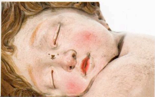
Niño Jesús dormido, abrazado a la cruz Anónimo Siglo XVII

Los tesoros artísticos guardados en las clausuras de los conventos y monasterios madrileños son capaces de transmitir las profundas e intensas formas de religiosidad como expresión del mundo de silencio y recogimiento interior que rodea la vida de las congregaciones religiosas. Pero también constituyen piezas fundamentales de la historia del patrimonio cultural de una sociedad, de la que los propios conventos y monasterios son parte en el intrincado, y a veces misterioso, conjunto de relaciones que muchos hombres y mujeres establecieron y establecen con su Dios. Un patrimonio histórico que ha ido dejando sus huellas profundas y contundentes unas veces, apenas imperceptibles y delicadas otras, para pasar a formar parte de la memoria colectiva de toda una sociedad.