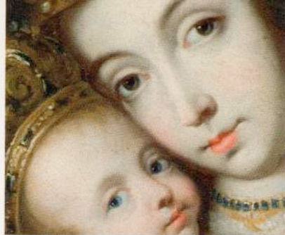
Virgen de Belén Anónimo español Siglo XVII