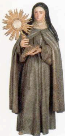
Santa Clara de Asís Pedro de Mena 1675