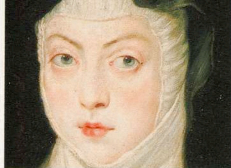
Retrato de Sor Ana Dorotea de Austria Pedro Pablo Rubens 1628

Y cuando María, la virgen madre, adquiere diferentes rostros recordando a los fieles su condición y convirtiéndose para ellos en un objeto de culto, también estos rostros expresan el profundo sentido de la maternidad incitando a la tenura, a la protección o la belleza interior.