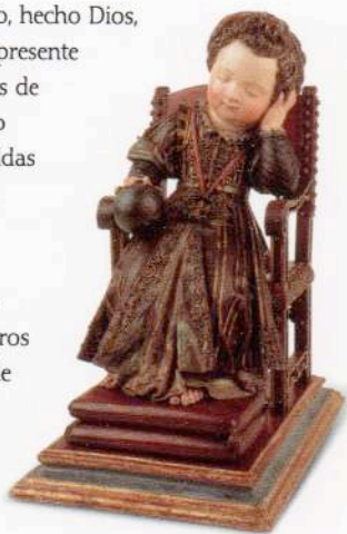
Niño Jesús dormido Escuela española Finales del siglo XVI

Estos Niños son también muestra del esmero por dar una imagen de la condición humana en sus primeros años de vida, adquiriendo esa doble condición de ser representaciones del hijo de Dios y del arte barroco madrileño.