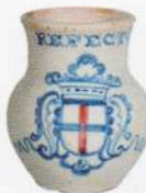
Jarro de beber Talavera de la Reina Segunda mitad del siglo XVIII